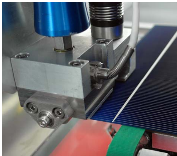
Neu entwickelter Dispensierautomat am Fraunhofer ISE mit 10-Düsendruckkopf.

Freiburg, 16. Oktober 2014 Nr. 24/14 Seite 4