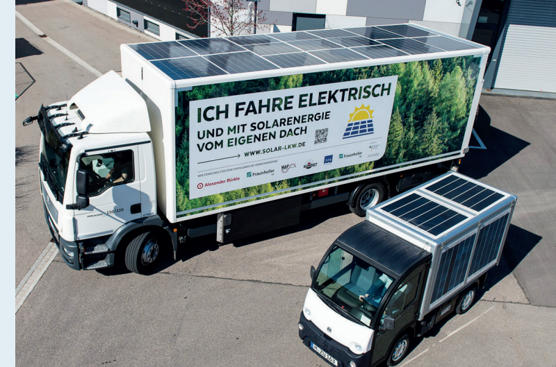
E-LKW und Mini-E-LKW mit Photovoltaikmodulen.

Eine Messkampagne des Fraunhofer ISE aus dem Jahre 2017 hat ergeben, dass ein typischer dieselbetriebener LKW-Auflieger mit 40 Tonnen in unseren Breitengraden zwischen 1500 und 2100 Liter Diesel jährlich durch integrierte PV-Module einsparen kann.